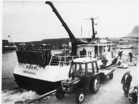
Ritan – strandfaraskipið, sum í løtuni rúkir rutuna til Nólsoy – hevur ikki vakt artikkalliskipan fyri manning sína, sum tí ikki fær veitt nólsoyngum ta neyðugu hjálpinu, tá ið á stendur

Hann heitur, at lóggevandandi valdið eigur at læra av gjørdum mistøkum, binda um heilan fingur og veita nólsoyngum ta sjálvsagdu trygdina, sum ein tilkalliskipan til manningina á Rituni hevði givið. pól