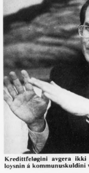
Kreditteflogini avgera ikki einsamøll, hvussu endaliga loysnin á kommunuskuldini verður