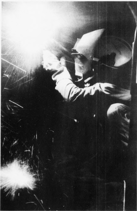
Tað er umráðandi at kunna vinnuna um tær tænar vit kunnu veita, tí talan er um virksemi, sum kann kanalisera út í so ómetaliga nógv lið í føroyska samfelagum