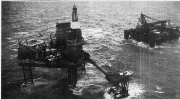
Bretland og Føroyar eru næstu grannar og tað eru veldugar tíðir, sum nú hómast úti í havsbrúnni, og tær eru nú so nær, at borast kann á skák inn undir okkara egna mark