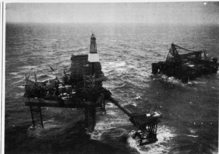
Norska stjórni fer í næstum at koma við uppskoti, sum skal gera tað lættari at vera oljuframleiðari í Norra. Oljuflutur, ið bora eftir olju á norskum øki, hava gramt seg um hoga skattin og avgjald, og norska stjórni ætla nú at bota um korini hjá teimum

Diplomatur í Bagdad vita at síga, at Iran, hóast tað verður avannað, hagar, hevur keypt olju fyri spottprís frá landinum, sum teir vóru í krígg við tíðarskeiðið 1980 - 88, sjálvst um