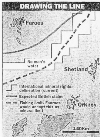
Mest sannlíkt er, at móguligar oljukeldur eru tætt við miðlinjuna. Men teir serkønu visa eisini stóran áhuga hjá Sandoyarbankanum og ørum leiðum

- Vit kunnu imynda okkum, hvussu stórir ágangur-inn hevði verið imóti Sambandsflokkinum, um hann hevði átt lut í hesum avtalum. So hevði loysingarflokkarnir fingið eitt nið 1906- ella 1948-syndrom.