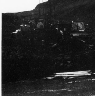
Í 1981 varð farið undir royndarboringar í Lopra.

Mest sannlíkt er, at móguligar oljukeldur eru tætt við miðlinjuna. Men teir ser-