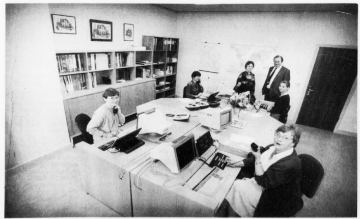
Hesar taka telefonina, tá ringt verður til -Nummarkall-. Fyrra terminalar eru í nýggja borðsalinum

Telefonfundir Møguleiki er fyri fleiri nýggjum tænastum við hesum nýggja borðsalinum.