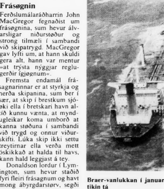
Braer-vanlukkan í januar 1993 fekk aveiðingar. Mynd tikin tá