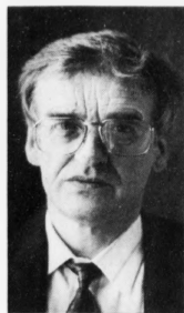
Tummus Arabo: - Landsstjórnir fer í næstum at víðgera málið

hetta hevði verið gjørt við víkjandi øðrum fiskikvotum.