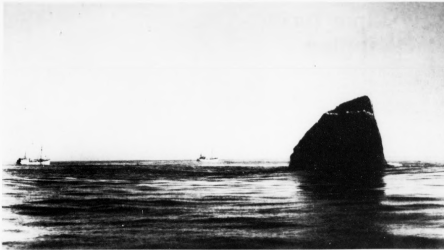
Bretar nýta allar snildir af krökja undir seg haveiðir og hasbotn. Öll útsker - stór og smá - Rokkurin, sum all íbúðast um, tí hann var vandamikil fyrri skipaferðsluna á besum leiðum til ríku oljuleiðdar. Ein ströpspurningur hest seinastu árin hefur verið, um hesin steinar er partur af feroyska landgrunninum ella af bretska megnlandstjóðnum

krövum, oljuginnann settir viðvikjandi kappingartíri. Talan er um tenastu 24 tímar um samdögðin. Feroyskar fyrirtøkur kunnu t. d. gera -joint venture- avtalur við útlenskar fyrirtøkur, sum eru knyttar at oljuvinnu, og sum hava ymsa framleiðslu - alt frá matværum til ambød, segði hann.