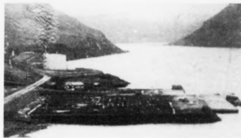
Havnalogni eiga longu nu at lagast til komandi oljvinnuna

Marknaðarnevndin hevar undir viðgerðin bvt seg í