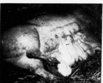
Alt bendir á, at bert grisastamman verður varðveitt í Frøðba. Restin verður slaktað og kjøt, ið ikki er mannaføði, verður tyrvt.

At bretar hava kannað sær ein leitan bita burtur av føroyska landgranninum eftir oljufaraskipið í marknastráttum um Jan Mayen, vísu vit, men at teir í einum tó