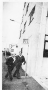
Tað almenna skal eftir oljum at óanna rinda yvir eina milliard komandi ár.

Og so eru tað útreiðslur, sum landskassin eina samallur rindar. Men av tí at teir sosialu mynduleikarnir hava fingið mannkervi frá hægri stáð, er tað ikki møgulegt at fía fatur á hesum tølum.