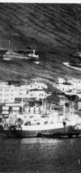
Tað kemur væl við, at nógv arbeiði er aftur á flakavirkinum í Vági. Tí í langa tív var at kalla púra oyðit í Suðuroyar býnum.