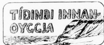
Kann trúgvin flyta fjøll (heim), so kann hon saktans flyta milliardi

Frabókun um eindeinstærst eða... sum vískaftandi um bládmum skriviliga í hendri í seinasta lagi kl. 10. dagin fyri, blaðið kemur út Merk- talog og sannað hann í goshar til tíðindalættingu. Box 19, FR 110 Torshavn. Í heimum má talaða til skilast, hvønn dag frabóðin in skal í blaðið.