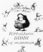
Ribbdárlinn BIBBI og mamman

Barnabókaklubbin hjá Føroya Lærarafelag var stovnað árið 1986. Í 1993 stovnaði Bókadeildin eisini ein ungdomsklubba Bókaklubbin UNG.