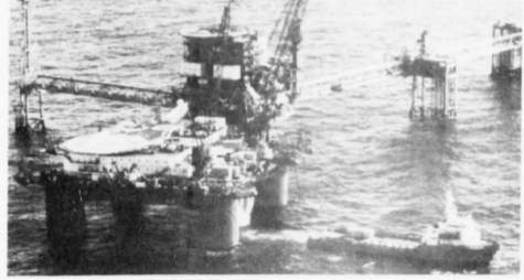
Edmund Joensen um miðlinjuspurningin:

Bjarti Mohr, Fiskasolu- stjóri sigur, at tað hevði hjátrúðir um at talga við í Føroyum um spásam- men markaðnum.