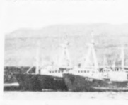
Tað var seinnapartin trolagin, at stóru partur av føroyska trolarabotanum stendi inn á Havni

Meðan meginparturin av trolarabotanum liggur í havin, og biðar eftir at útrok- loysin verður funin á hatti.