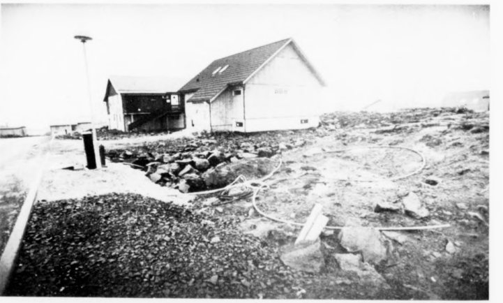
Stykkið, ið sæst á myndini, kann saktans gerast ein vakur urtagarður, men ta kveist nógv arbeiði og ráðgeving. Fólk vilja oftast gera arbeiðið sjálvi, men vita ikki ordiliga, hvussu farast skal fram

kann Hjalpirot geva kundinum eitt uppri ella eina strikumynd, ið kundin kann nýta til arbeiðsplanin. Kortini er tað langt frá øll, ið vilja hava ein urtagarð. Men tað er nu einarð soleiðis, ta ta tær titt egna, fylgir oftast eitt stykki av jørð við. Og fyrr ella seinni má ein avgerð tákast, hvussu hetta skal siggja út, og í hesum sambandi kemur ein inn á, hvussu fólk rokta urtagarðin.