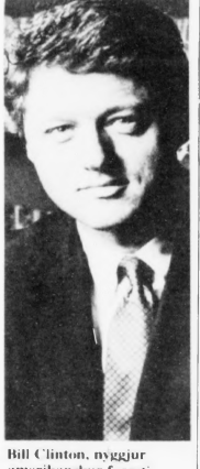
Bill Clinton, nýggjur amerikanskur forseti

seg, tá fólk trunkast saman, gjórdi tað eisini í Warrenin sunnudagin, so tað var um reppið, at ikki nakar varð krossur. Teinum lítillum horn, nærhendis røðarapallinum, var nákað av plassi avbyrgt til tóðafólk, sum fyrri tað mesta voru amerikannar. Men av tí, at amerikansku sendistovurnar hava sent ein heilk við 35 utendingum, heruppi í eisini nokrum laum, tóðafólkum, kann Dimmalætting breggia sær av at hava havt eitt umboð við Hini gestaumbóðini voru úr Italia, Estland, Japan, Vestara arabakka, India, Pakistan og Mongolia. Úr Warrenin forsetin við langa fylgi sínum vífari við kos mott Washington, har hann í morgin verður tikið í eina sum nýggjur forseti, og saman við familju síni flytur hann Hvíta Húsin. Tey skuldu verða nog ramlig til eini hýn við býlváksnari dottur.