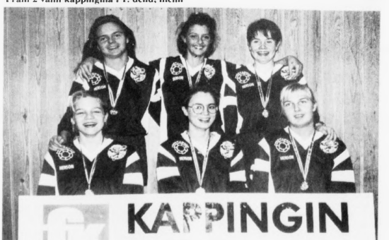
1. 2. deild, kvinnur, vann Fram