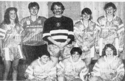
1.-deildarkvinnurnar hja TB vunnu sín ból