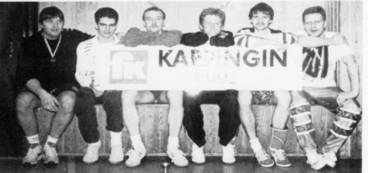
Eysturskúlin vann 2. deild hja monnum