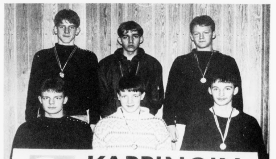
Fram 2 vann kappingina í 1. deild, menn