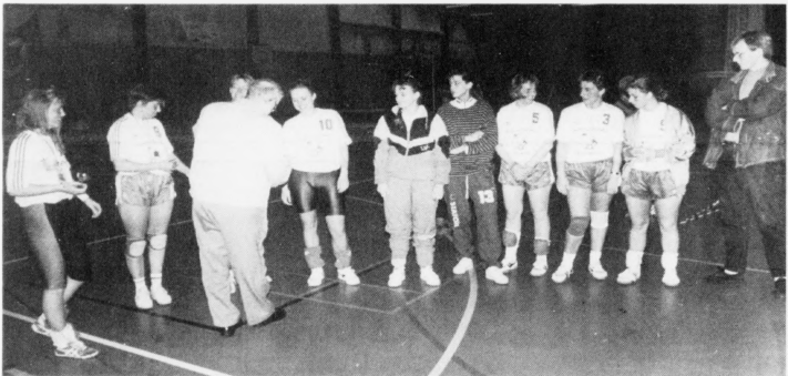
Flejr A gjørdist vinnari í meistaraedeidini fyrri kvinnur