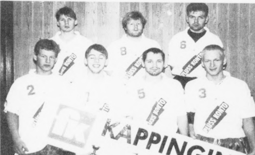
Flejr vann í meistaraedeidini, menn