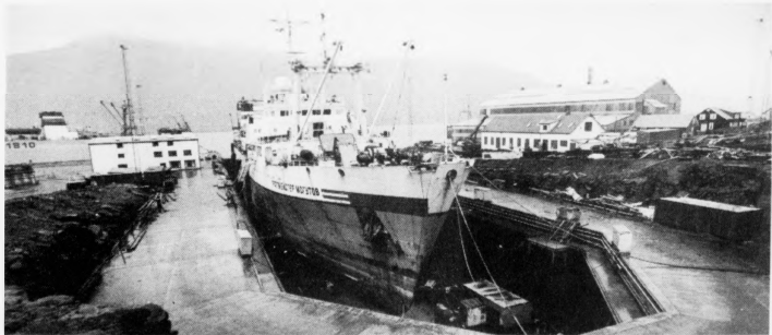
Í lötuni arbeida umleið 75 mans í tryskiftisvakt á Skipasmiðjuni Føroyar, flestu umboð á hesum skipinum Tralmeyer Mogutov. Hetta arbeidið varar minst ein mánað afturat

for umvælingar. Skipasmiðjan Føroyar hevur ikki fleiri avtalur við russar fyrri ár, og nakrir av teimum 75 arbeiðsmönnum kunnu tí rokna við at missa arbeidið, ta ið stóra umvælingin er lóður um boð á Tralmeyer Mogutov, men Rini Jacobsen sigur tó, at tað kunnu væl koma onnur russisk skip til umvælingar.