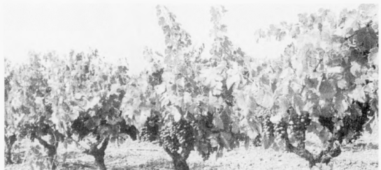
Soleiðis siggja vínplanturnar hjá Bregancon út, tá vindið er burað og skal takast inn til at framleiða Rosé. Sólin og hitin gera, at nóg mikið av sótveini er í víninum, og einki eyka sótveini ella annað verður tilsett.

Í Frankaríki eru landslutir, sum eru kendir fyri sítt serliga vínslag, tað veri seg reytt vín ella hvítt vín – Er talan um Rosé, skal tað vera frá Provence – Har grógva drúvsløgin, sum nýtt verða til Rosé-framleiðslu, ógvuliga væl, av tí at sólin skínur meiri enn 3000 tímar har árliga – Mistralurin, hin kendi turri vindurin, ger, at skaðadýr og sjúkur so at siga ikki trívast á plantunum á hesum leiðum, og tí er ikki neyðugt við eitursprenging –