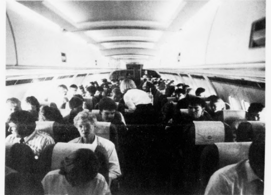
Tilsamans 90.398 ferðafólk ferðadust um flogvøllin í Vágum 1991

Oktober hevði stóra afturgongdin í ár. Sagt verður úr Vágunum, at talið í dag, uml. 90.000 ferðafólk, er eitt passaligt