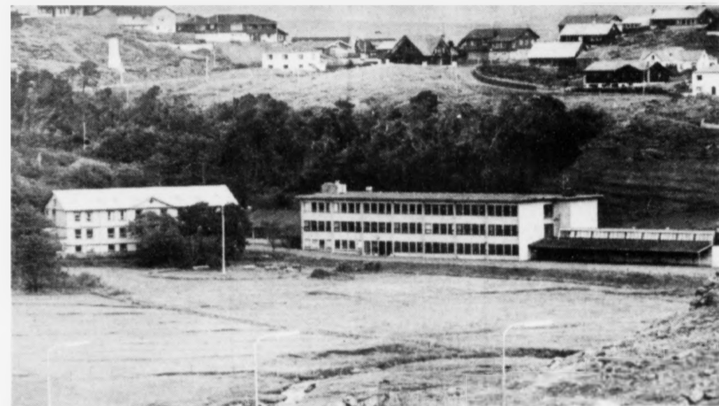
Høllsviðurskiptini hava ikki verið í lagi seinastu 10 árin á Studentaskúlanum í Hoydølum