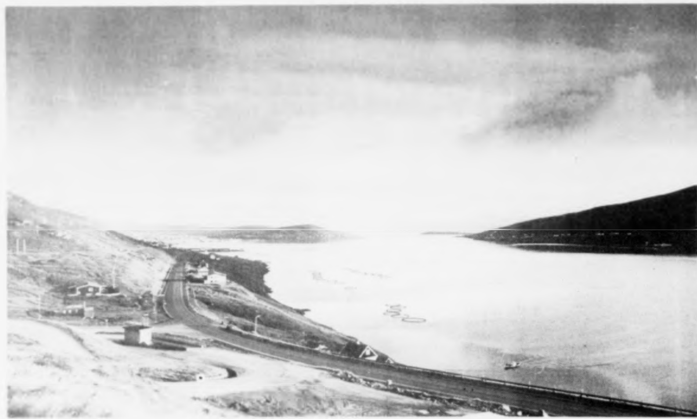
Pallar og hjálparskip eru ikki í arbeiði alt árið. Skálafjørðurin hóskar avbera væl at hava hesi liggjandi inntil arbeiði verður tikið upp aftur. Hetta er mál, sum stýrið fyri Kongshavnar Havn í framtíðini kemur at viðgera nágrenniliga.