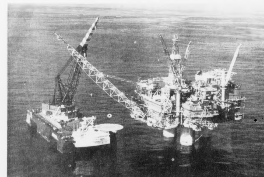
Í sambandi við samtakið, Offshore Europe 91, sum verið hevur í Aberdeen í døgunum 3. til 6. september, hava føroyingar nú fingið møguleikan at melda seg til 3 mánaða skeið innan oljuvinnuna. «Dynamic Position Course»