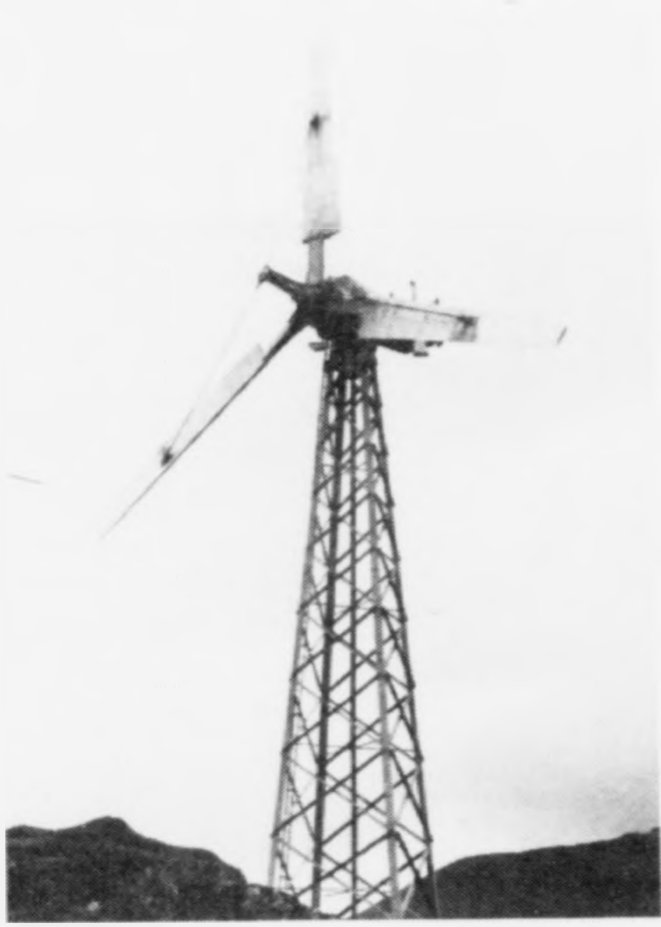
SEV er í realitets-samráðingum við Oilwind um gerð av eini vindmylnu, ið møguliga verður sett upp við Gjellingarklett – vestan fyri Húsareyn.

– Vit hava nevniliga fyrr verið í samráðingum við Vestas um eina vindmylnuætlan, men Vestas kundi ikki góðtaka okkara upp-