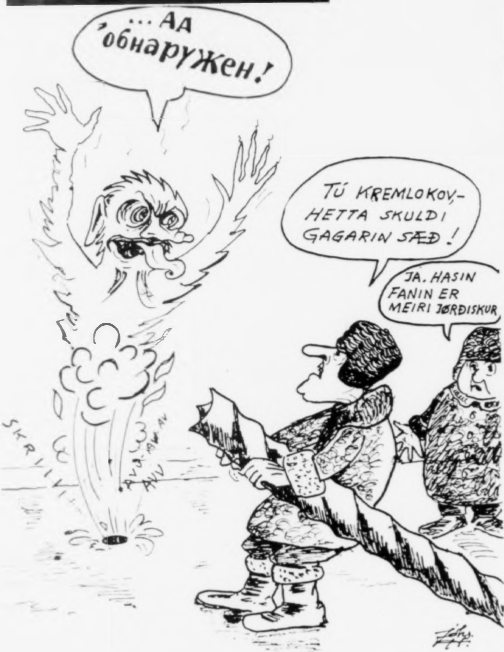
Helvitispersón í staðin fyrri rúmdargud?

Gagarin sá óngan gud í rúmdini. Men smb. Pravdugrein í Dagblaðnum 17. juli hava aðrir russiskir vísindakommunistar nú sæð ein annan persón stíga beinleidis upp úr helviti.