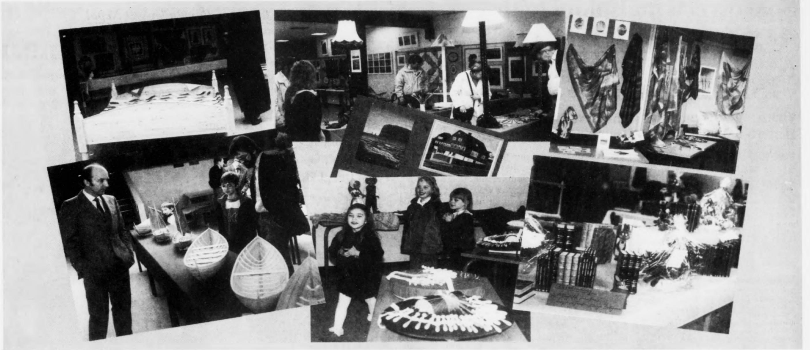
Nógv kemur burturur einum vetri á Kvøldskúlanum. - Frá framsýningini seinasta ár